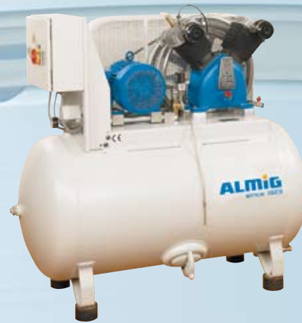
HL auf Behälter